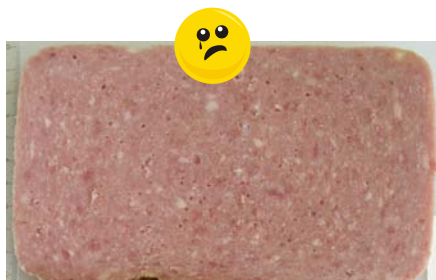
Aussehen: wie Brühwurst

Häufig finden in der Gastronomie Erzeugnisse Verwendung, die einen grundlegend anderen Charakter hinsichtlich Aussehen und Fleischanteil als die unter 1 bis 3 beschriebenen Produkte aufweisen. Es handelt sich nicht mehr um „Schinken“, „Vorderschinken“ oder „Formfleisch(vorder)schinken“, sondern um Erzeugnisse eigener Art . Diese sehen z. B. so aus: