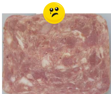
Aussehen: wie Schweinefleisch- konserve

Fleischanteil: 55 % Zuges. Wasser: 34 % Stärke: 5 %