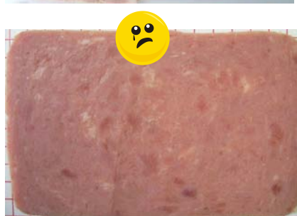
Aussehen: wie Corned Beef

Fleischanteil: 56 % Zuges. Wasser: 29 % Stärke: 12 %